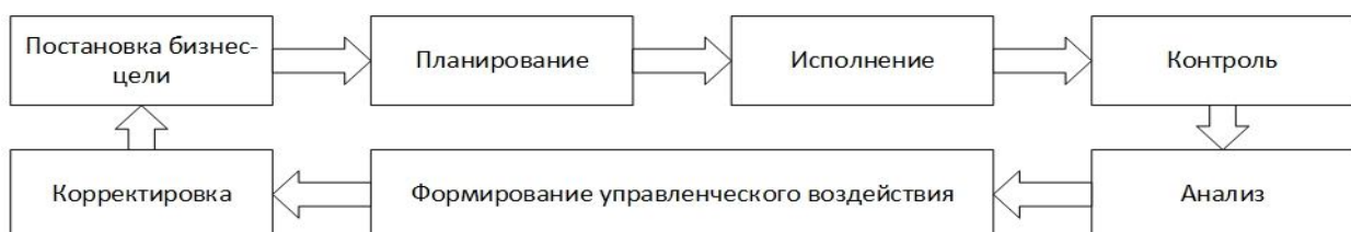
Рис. 1. Классическая модель управления