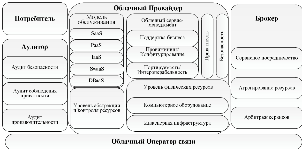
Рис. 2. Эталонная архитектура облачных вычислений NIST

стандартов облачных вычислений. В этом же документе отмечено, что модель облака содействует доступности и характеризуется пятью основными элементами (самообслуживание по требованию, широкий доступ к сети, объединенный ресурс, независимое расположение, быстрая гибкость, измеряемые сервисы).