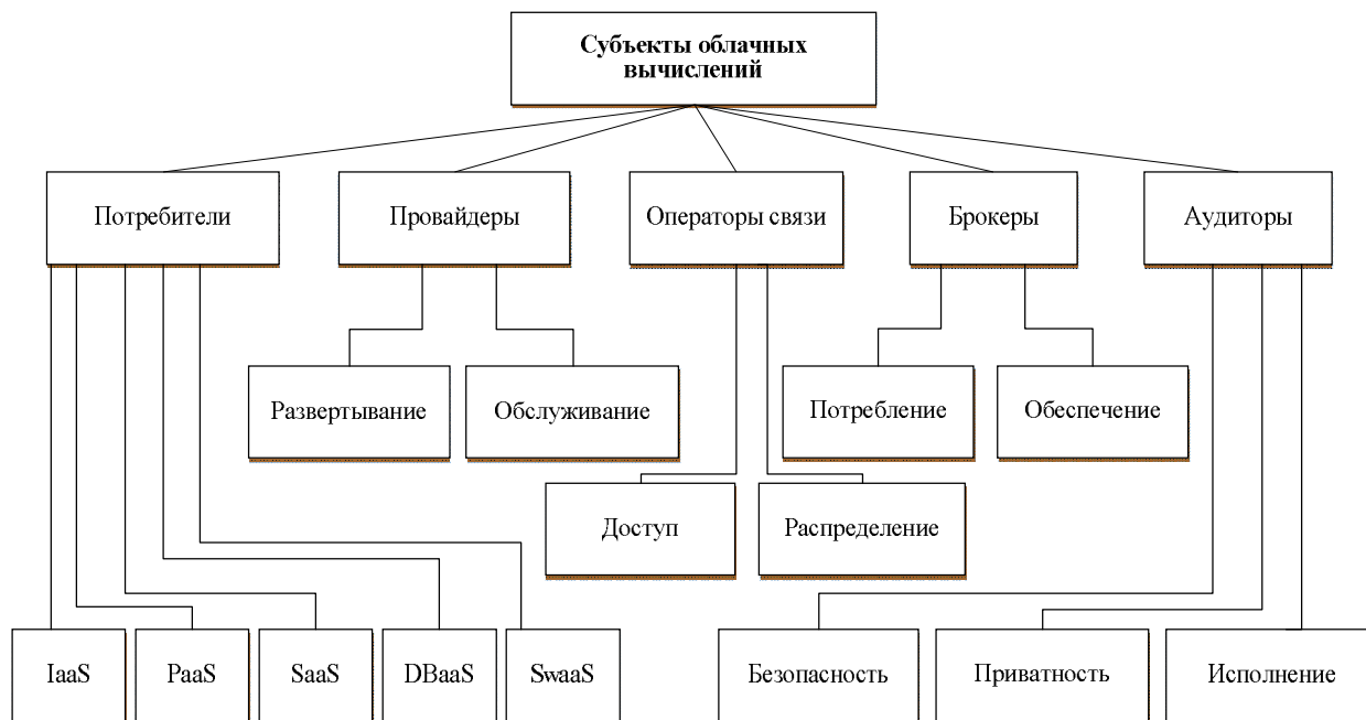
Рис. 3. Вложенная таксономическая схема субъектов облачных вычислений