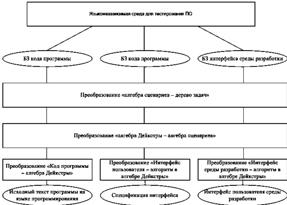
Рис. 1. Структура среды тестирования программ

граф задач, совместно с добавленными в него переменными рассматривается системой тестирования с целью анализа программы на соответствие алгоритму и выявлению ошибок (рис. 1).