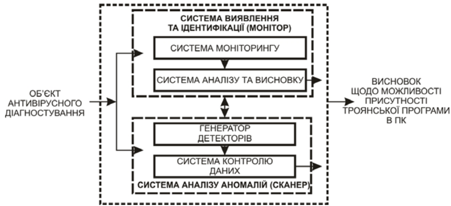
Рис. 1. Система пошуку троянських програм в персональних комп'ютерах

Сканер включає в себе генератор детекторів та підсистему контролю даних. Метою сканування ПК, що діагностується, є виявлення аномалії. Під аномалією будемо розуміти виявлення факту підміни системних фалів троянськими версіями [5].