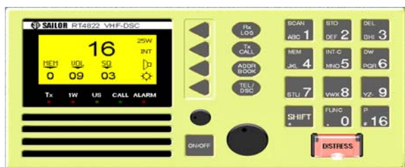
Рис. 1. Внешний вид панели УКВ ЦИВ радиостанции RT4822.

На рис. 1 представлен внешний вид наиболее широко используемой УКВ ЦИВ радиостанции фирмы SAILOR RT4822.