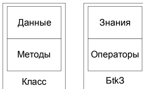
Рис. 1. Сравнение основных понятий ООП и ИКЗ

По определению, в терминах ООП, класс – особая структура данных, которая может содержать методы для их обработки. В теории ИКЗ такой особой структурой является БtkЗ, которая содержит также операторы для манипулирования знаниями, позволяющие обучить БtkЗ (IND-оператор), доказать полноту базы знаний и адекватность обучающим данным (RED-оператор, POZ-оператор), а также получить решение относительно ОПР (DED-оператор). На рис. 1 представлено сравнение основных понятий ООП и ИКЗ.