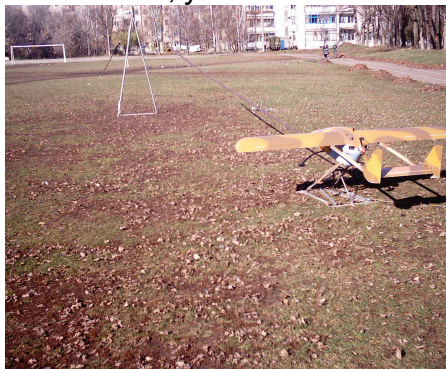
Рис. 4 Общий вид двухшнуровой катапульты с БЛА «ХАИ-112»

На рисунках 4 и 5 представлены фотографии беспилотного летательного аппарата «Бекас», установленного на двухшнуровую резиновую катапульту