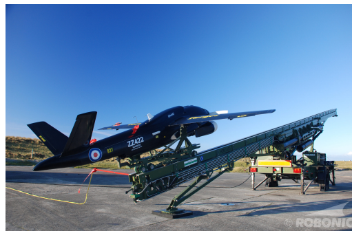
Рис. 2. Беспилотный летательный аппарат «Hermes 450» на направляющей пусковой установке финской фирмы Robonic