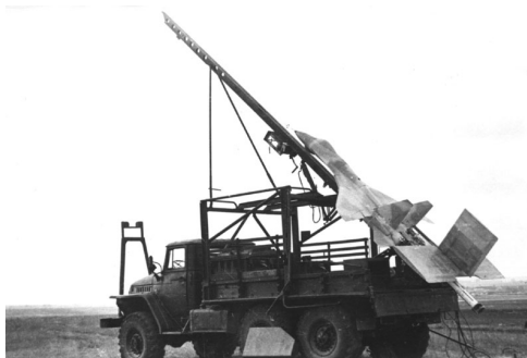
Рис. 1. Пусковая установка с направляющей и моделью СЛМТ-10