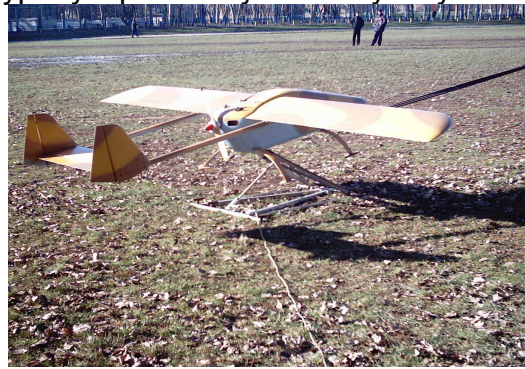
Рис. 5 БЛА «ХАИ -112» на рамке двухшнуровой катапульты