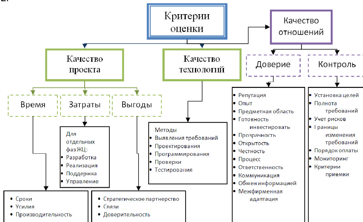
Рис. 2. Критерии оценки подрядчика на основе качества процесса разработки

Таким образом, можно построить иерархию критериев выбора подрядчика на основе качества процесса разработки ПО. Такая иерархия изображена на рис. 2.